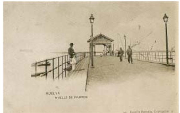
El quiosco era de madera labrada, de gran originalidad que daba cierto toque inglés adornando el embarcadero. Las noches de verano se llenaba de paseantes que buscaban el fresco de la brisa marinera.