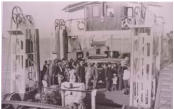
Esperando para el embarque.