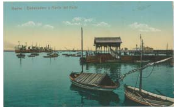
En 1895, se construye el Muelle de Viajeros o Embarcadero destinado al embarque de personas de paso a Corrales, Aljaraque y Punta Umbría, por medio de botes o canoas.