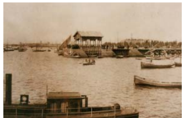
Fue desmantelado en 1915 y el templete trasladado a la Glorieta del Muelle Norte.