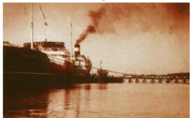
Son varias las grandes compañías que poseen muelle propio.