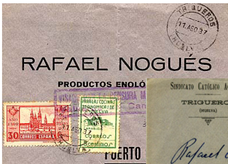
Carta enviada desde Trigueros al gaditano municipio del Puerto de Santa María con franqueo «nacional» (Año Jubilar Compostelano de 1937), benéfico de Huelva 329 verde y Censura Militar estampillada de Valverde del Camino.

La correspondencia de esta localidad es enjuiciada en la vecina Valverde del Camino; así lo prueban los sobres que mostramos a continuación.