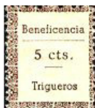
nº 713 5 cts. castaño.