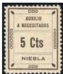
Cts sin punto.