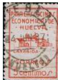
También utilizó en su correspondencia benéficos de Huelva.