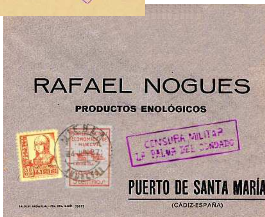
Carta al Puerto de Santa María, igualmente, con Censura Militar de la vecina localidad de La Palma del Condado.