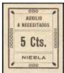
nº 521 sin dentar.

Como habitualmente sucede, en este tipo de sellos, es difícil no encontrarse con algún tipo de error o variedad; en este caso, conocemos estos que presentamos a continuación.