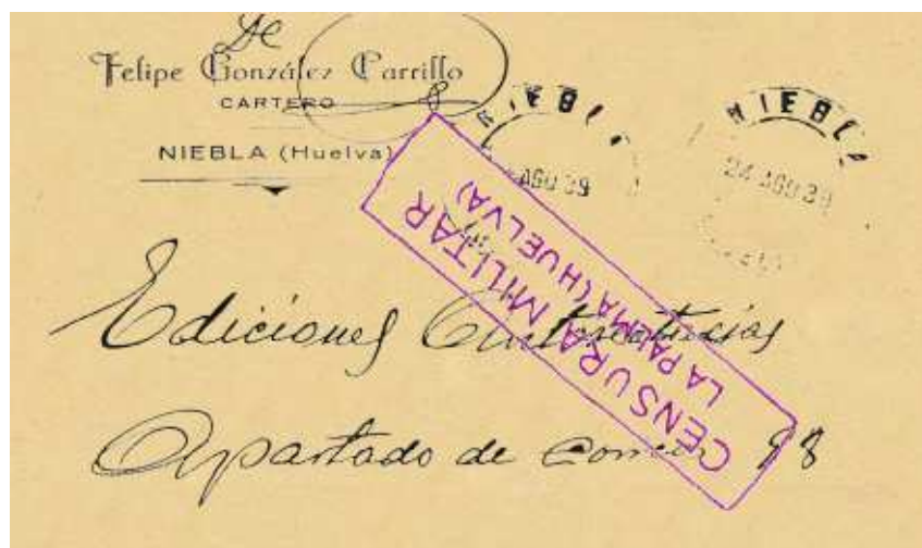
Carta, con franquicia por la profesión, enviada por un cartero desde Niebla el 24 de Agosto de 1939 y con Censura Militar de la vecina localidad de La Palma del Condado.

Por los sobres obtenidos de la época es, en La Palma del Condado, donde la correspondencia ilipense era censurada.