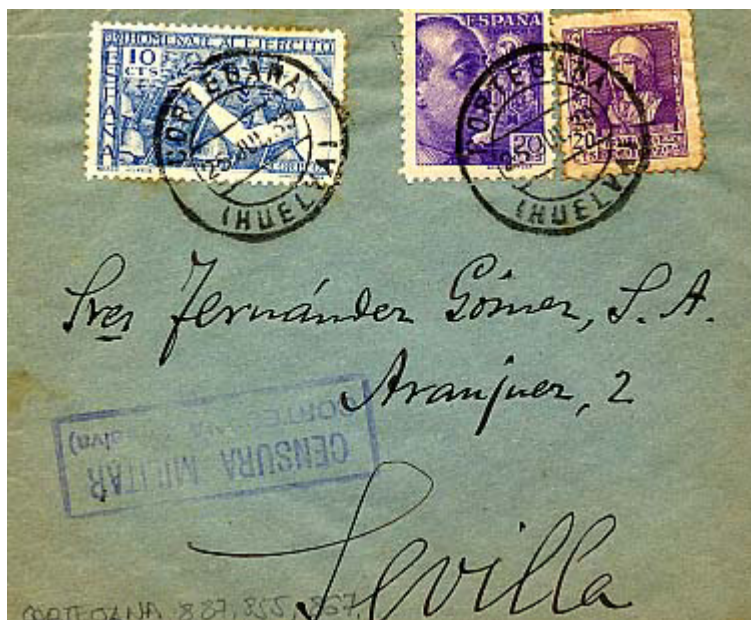
Carta (posterior a 18 de julio 1939) de Cortegana a Sevilla con Censura Militar C127.3 y franqueo «nacional».