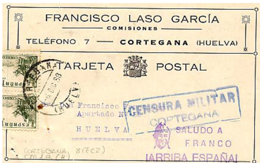
También con Censura Militar C127.2 mostramos esta bonita Tarjeta Postal dirigida de Cortegana a Huelva en la que aparece, además, una Sobrecarga Patriótica.

Y en la tercera se añade (Huelva) a CORTEGANA.