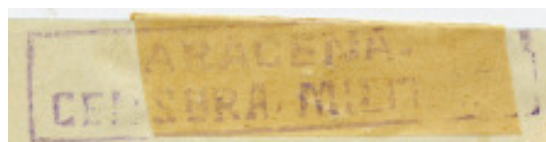
A106.1a 61 x 10 Color: Violeta (no catalogada).

Composición de una carta a Huelva con benéfico de la localidad, motivos patrióticos y Censura Militar A106.1.