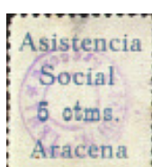
nº 62 5 ctms. azul.

Con sobrecarga comercial de la localidad.