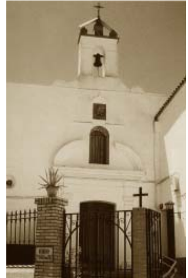
Ermita de Santa Ana.