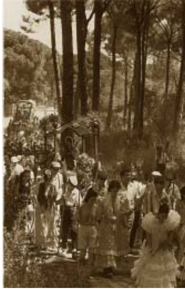
Romería entre los Pinos.