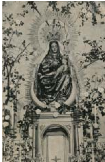
Nuestra Sra. del Reposo.

Tras la reconquista del reino de Niebla por Alfonso X el sabio, perteneció a este Condado con el nombre de «Facanías» hasta 1462 en que aparece por primera vez el nombre de Valverde del Camino.