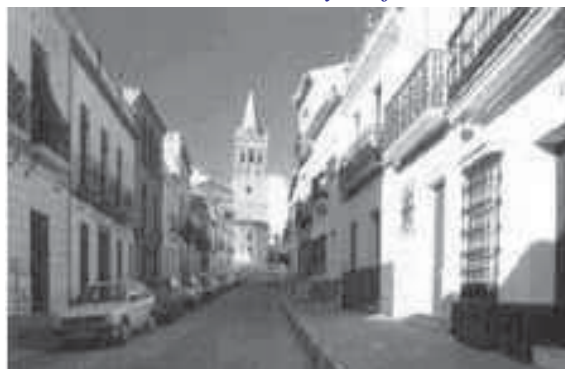
Calle Real de Abajo.