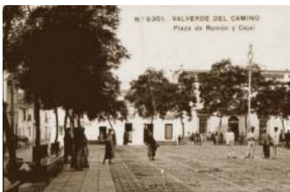
Plaza Ramón y Cajal.

Con la dominación romana se convierte en un importante centro de intercambio comercial.