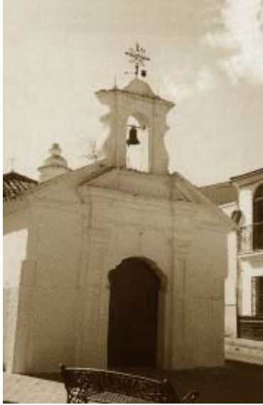
Ermita de la Trinidad.

Otros edificios dignos de atención son las ermitas de la Stma. Trinidad (s.XVIII), de Santa Ana o la recientemente construida del Santo (1961) del más puro estilo barroco sevillano.