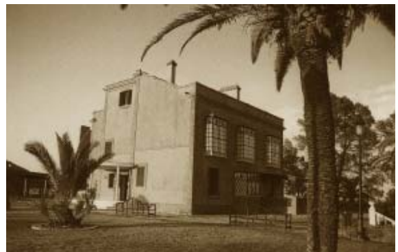
Casa dirección (1912).

Son destacar sus Carnavales, que prohibidos por el régimen franquista, celebraban en los Pinos; esto fue origen de multitud de multas y otras represiones.