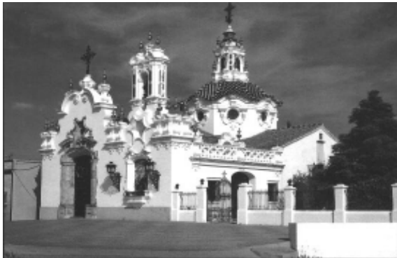
Ermita del Santo.