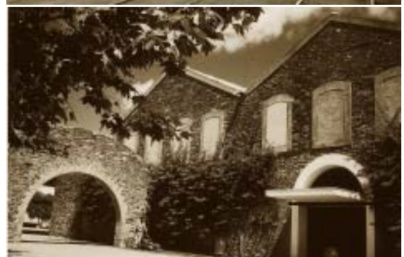
Talleres del ferrocarril.