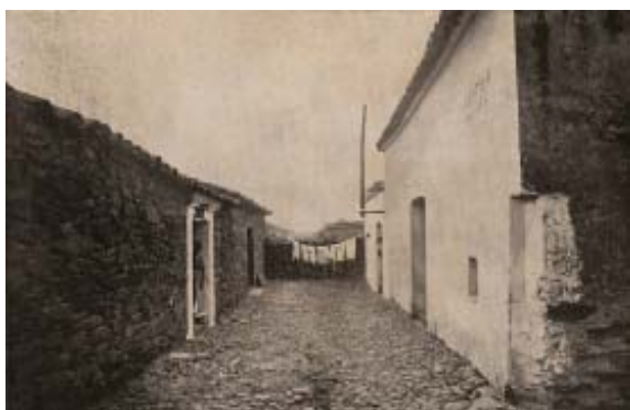
Las cuatro casas (origen del casco antiguo).