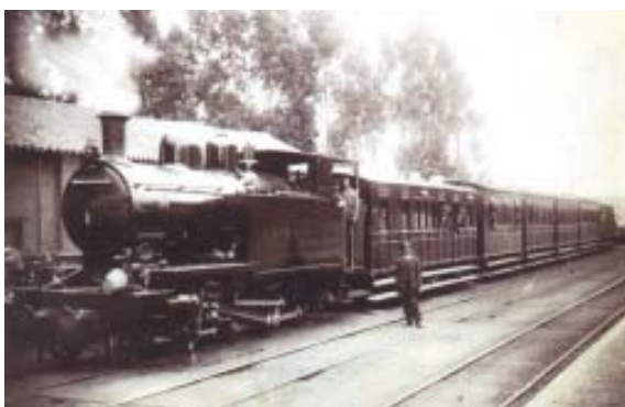
Locomotora nº 16 San Cornelio.