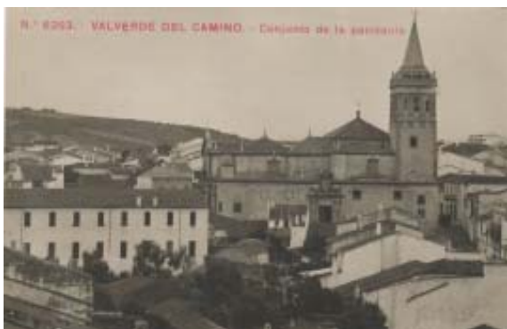
Panorámica e interior de la Iglesia.