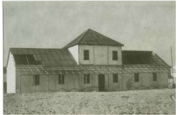
El Albergue de la Colonia Escolar.