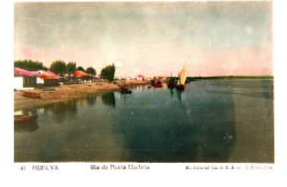
41 HUECVA Baía de Punta Urdía Alameda de S. A. de S. Pedro