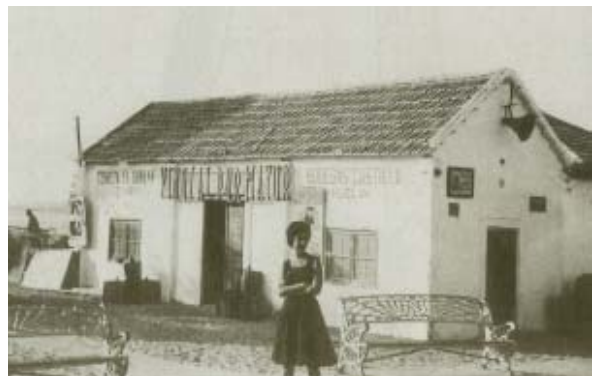
Venta de Vinos al Mayor.