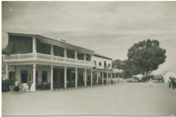
«El Casino» : Bar La Esperanza.