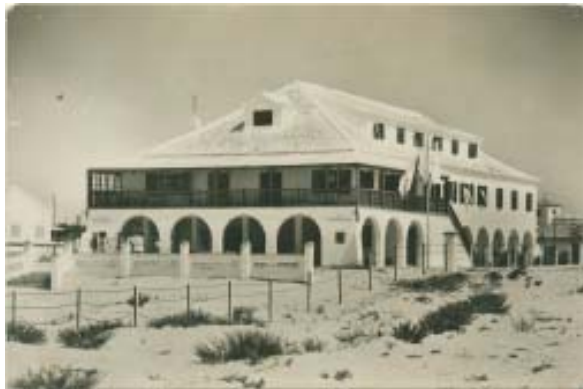
La Vieja Guardia, hoy albergue.