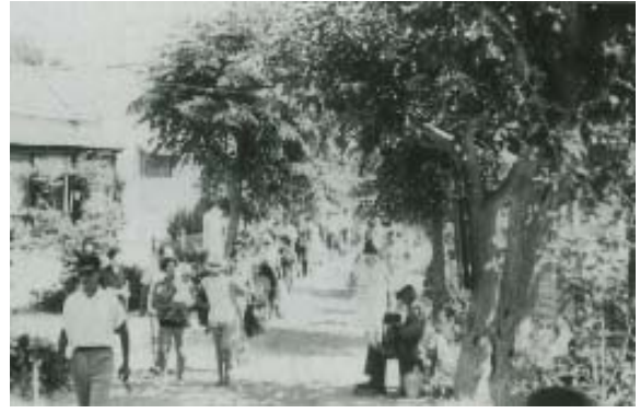
Tocando el acordeón en una esquina de la Plaza Pérez Pastor.