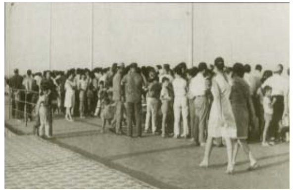
Esperando en el Muelle de las Canoas.