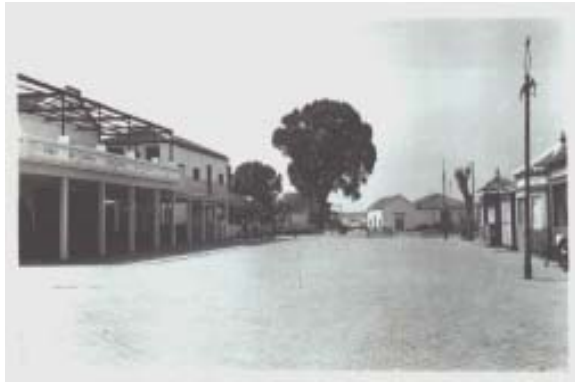
Plaza Pérez Pastor.