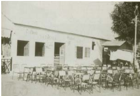
Bar «La Española».