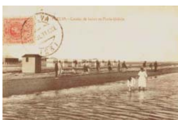
Caminos de madera hasta la playa.