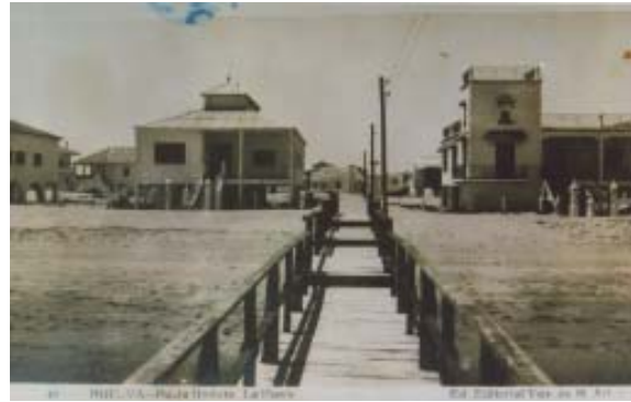
Pasillo hasta el embarcadero.