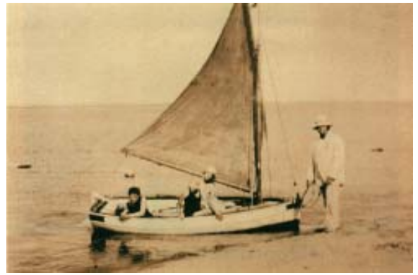
La ría fue siempre un excelente lugar para realizar deportes náuticos. La ausencia de grandes barcos y su tranquilidad lo hacía propicio.