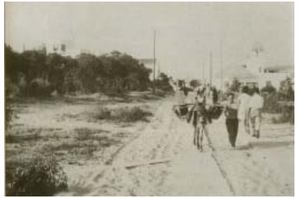
Llevando las maletas a los chalets.