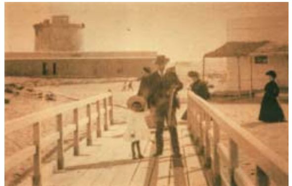
El muelle y la torre.