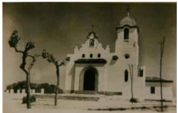
La iglesia del Carmen.