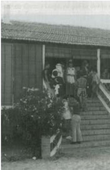
Típica fiesta de disfraces en un chalet.