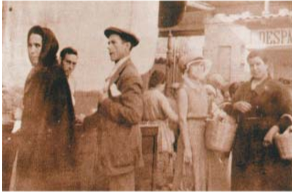
Una mañana en el Mercado.