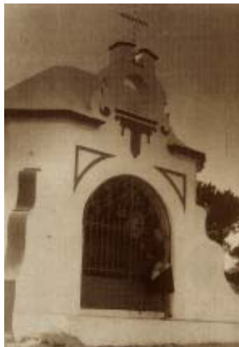
La Capilla de la Cruz.