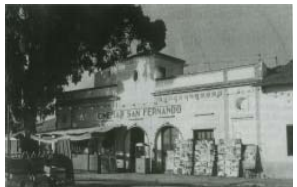
Cine San Fernando.