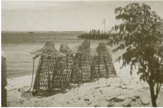
Nasas preparadas para salir de pesca.