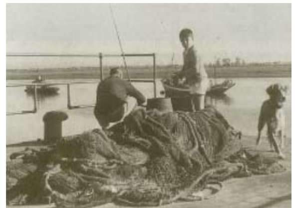
Preparando las redes.