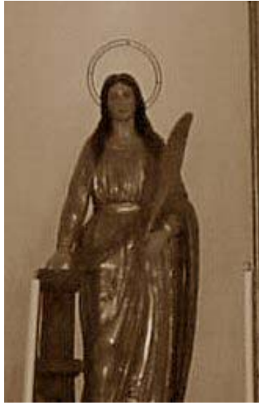
La patrona, Santa Bárbara.

De la época minera, hoy de nuevo sin actividad, se conservan el malacate de mina vieja y el de la nueva, así como los restos de bastantes dependencias.