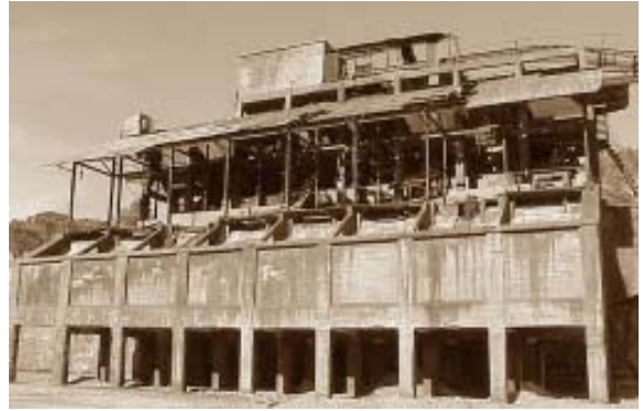
Oficinas mineras (restos).

De la época minera, hoy de nuevo sin actividad, se conservan el malacate de mina vieja y el de la nueva, así como los restos de bastantes dependencias.