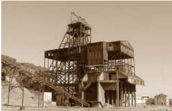
Malacate mina nueva.

Entre sus edificios más representativos, caben destacar, la Iglesia del Sagrado Corazón de Jesús y el Casino Minero.