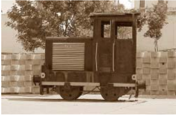
Vagoneta minera, hoy de exposición.