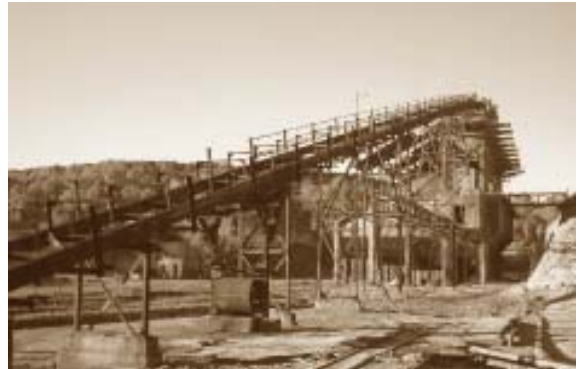
Depósito del mineral.