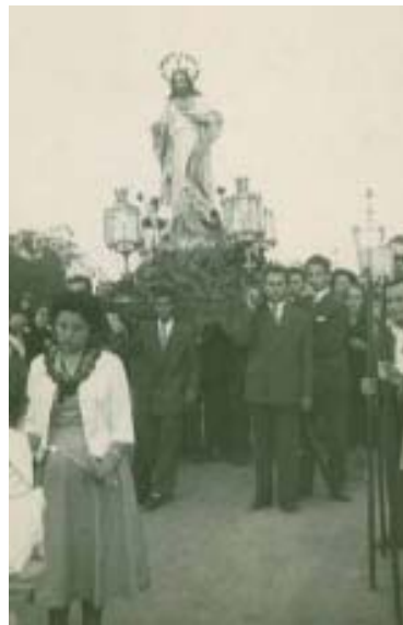
Procesión del Sagrado Corazón de Jesús.

Entre sus platos típicos se encuentran las tortillas de bacalao, el salmorejo y los gurumelos.