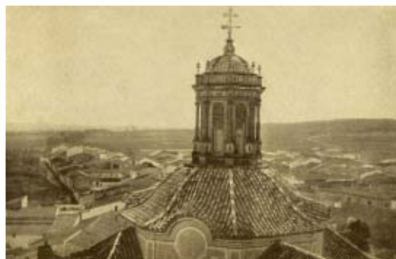
Cúpula de la parroquia.

De la dominación árabe se conserva una fortaleza y el torreón almenado de la Iglesia o Capilla del Valle.