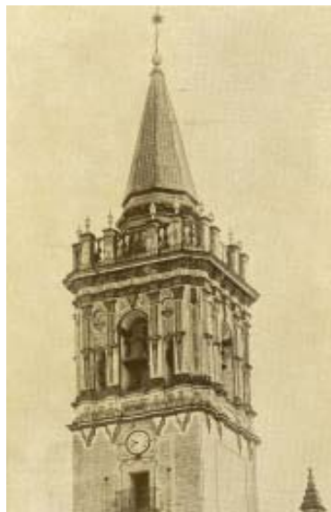
Torre de cerámica vidriada de la barroca Iglesia de San Juan Bautista acabada en 1768.