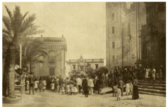
Procesión del Corpus.