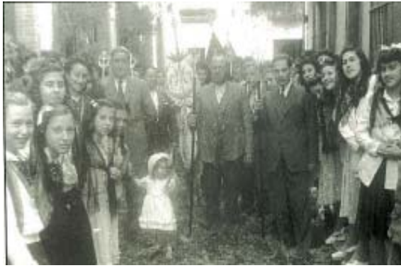
Las Cruces de Mayo.