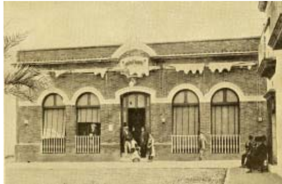
Centro Industrial y Agrícola.