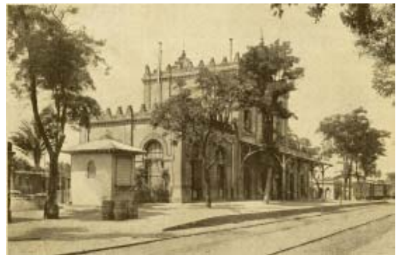
Estación del Ferrocarril.