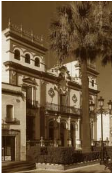
Ayuntamiento neoclásico de los años 20.

En Septiembre celebran la Real Feria de la Palma y Fiesta de Vendimia, la Semana Santa y en Mayo «Las Cruces» con los consabidos «piques» entre la de la calle El Cabo y la calle Sevilla, así como su tradicional Romerito.