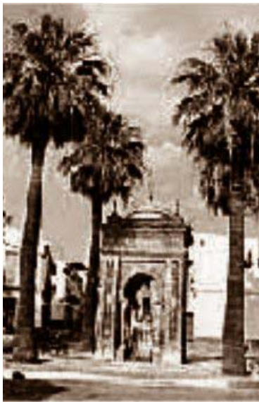
Placita de la Virgen del Rocio.