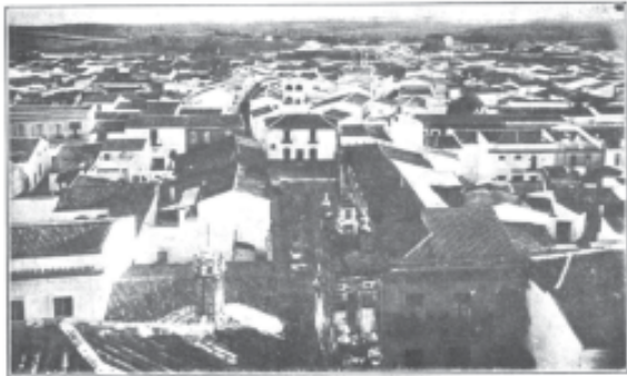
LA PALMA (Huelva). Vista aérea tomada desde la torre de la Parroquia de San Juan Bautista.