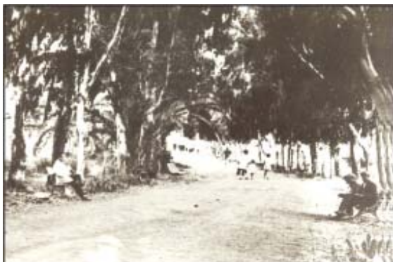
Camino a la Playa.

En 1934 se denominó, por vez primera, Isla Cristina; fue en agradecimiento a la reina M a Cristina por la ayuda humanitaria prestada por la monarca a esta población en una epidemia de cólera.