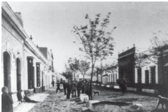
Paseo de Las Flores.

Entre sus edificios más notables se encuentran el antiguo Ayuntamiento, en ruinas a causa del terremoto de 1969, el templo de los Doce Apóstoles (s.XVIII), el de Ntra. Sra. de los Angeles y la Casa Consistorial.