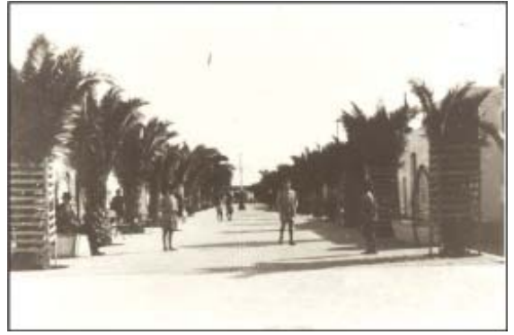
Paseo de las Palmeras.