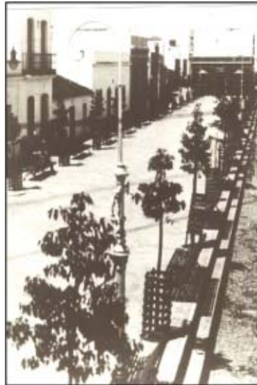
Paseo del Chocolate.

Es una reciente población, a la que llamaron «La Higuera», de poco más de dos siglos surgida de una fundación de pescadores. La pesca, salazón, conserva, sal... son sus principales ocupaciones.