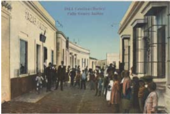
Calle Gómez Jaldón