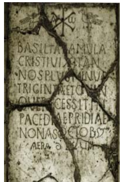
Lápida paleocristiana fechada en 568.

La Lanza es un baile ascencial de origen celta y lo realizan en la Romería de Nuestra Sra. de la Tórtola, a gran velocidad por sus empedradas calles.