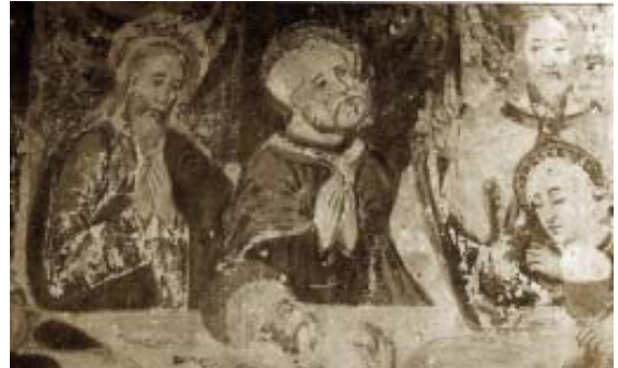
Frescos de la Iglesia (1490/1530)