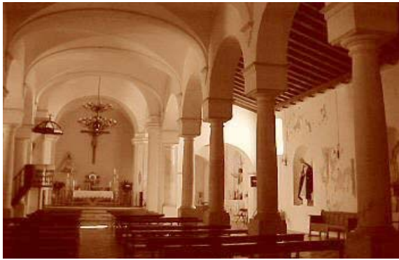
Iglesia de Guadalupe (interior).