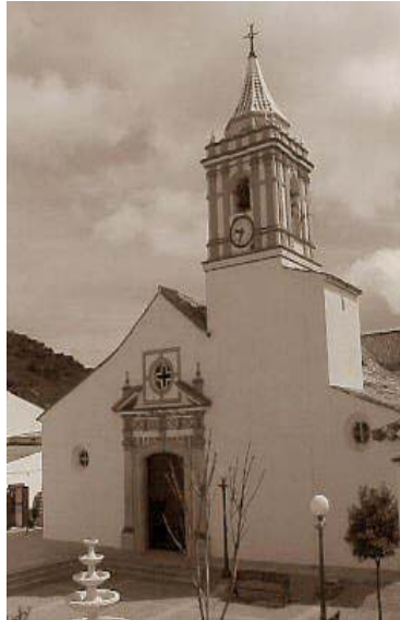
Iglesia de Guadalupe.