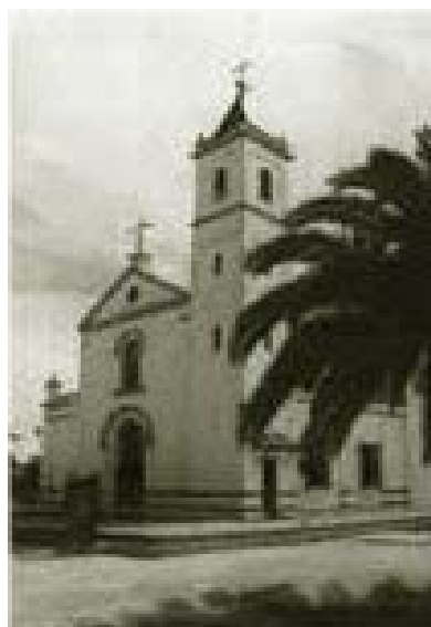
Ermita actual (1927).

También existen bastantes vestigios de la dominación árabe en las alquerías formadas en las antiguas villas romanas.