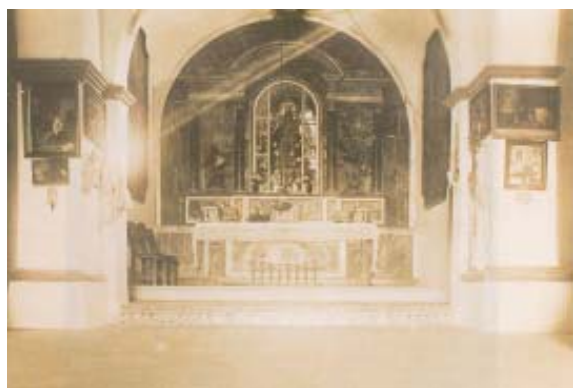
Interior de la antigua ermita.