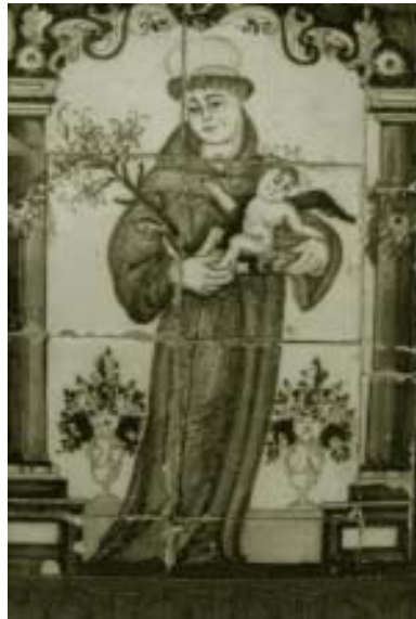
Monumento a San Antonio de Padua de 1774, situado en la calle del mismo nombre, es testigo cada año de la velada que cada 13 de Junio se celebra en su honor.