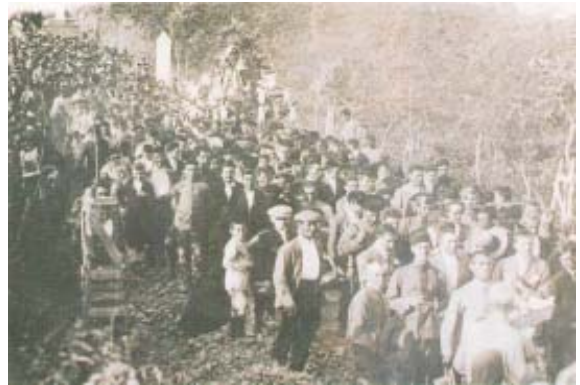
Llevándola a la ermita.

La Virgen, es traída desde su ermita para salir en procesión el 12 de Septiembre y también se hace para la procesión del día de la Inmaculada.