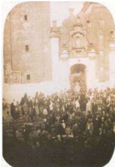
Salida en los años 20.

La Virgen, es traída desde su ermita para salir en procesión el 12 de Septiembre y también se hace para la procesión del día de la Inmaculada.