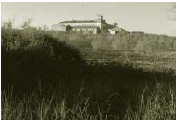
Caserío de la Dehesa.