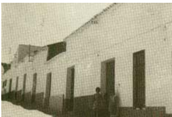
La Paloma, calle de jornaleros.