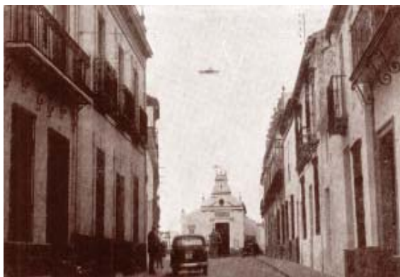
Calle céntrica y Capilla de Jesús.