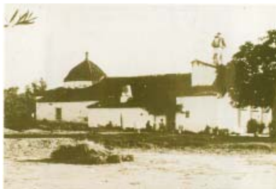
Ermita antigua y, adosada, la casa de los ermitaños.

La ermita, en las afueras de la población, es el resultado de varias remodelaciones de una ya existente del s. XV.