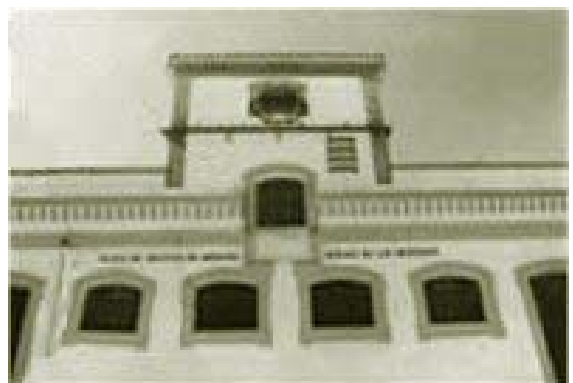
Plaza de abastos.