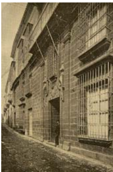
Casa de 1700