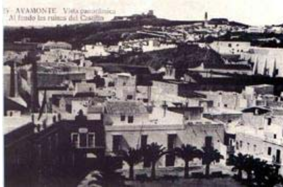
17- AYAMONTE. Vista panoramica Al fondo las ruinas del Castillo