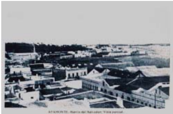
AYAMONTE, Barrio del Salvador. Vista parcial.