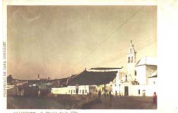
AYAMONTE - 4 - Barrio de la Villa