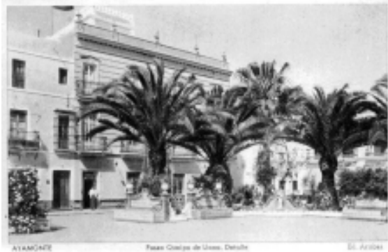
AYAMONTE Paseo Olímpico de Utrero, Detalle St. Arthur