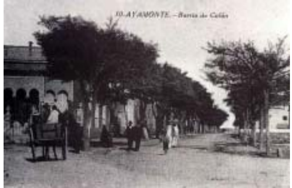
10 - AYAMONTE - Barrio de Cádiz