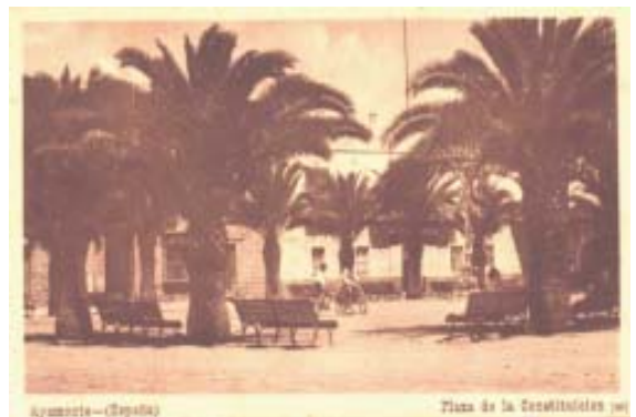
Plaza de la Constitución.