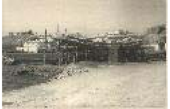
AYAMONTE, Avenida de la República.