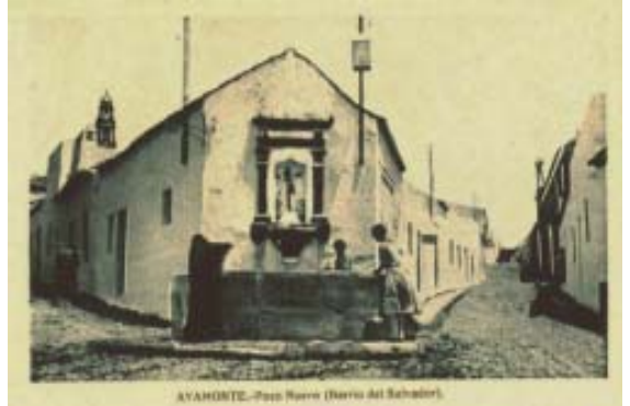
Barrio del salvador

Los monumentos artísticos actuales son todos de índole religiosa: La Parroquia del Salvador (1440) y de Las Angustias (1576) con importantes imágenes de Semana Santa, así como los conventos de San Francisco (1527) y Santa Clara.