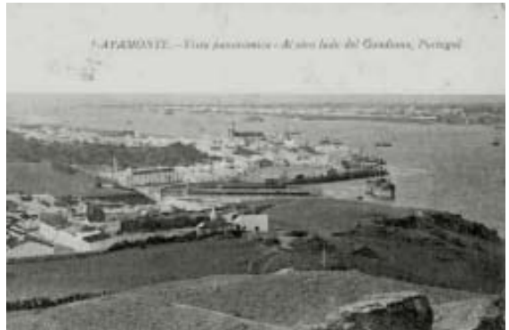
AYAMONTE. - Vista panoramica - Al otro lado del Castillo, Portugal