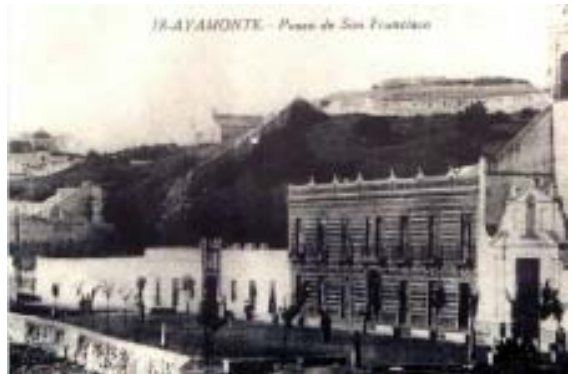
18 - AYAMONTE - Paseo de San Francisco