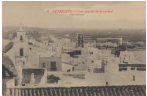
8. AYAMONTE. - Vista parcial de la ciudad