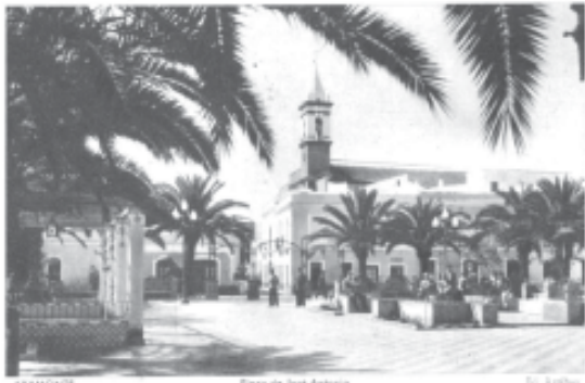
AYAMONTE Plaza de José Antonio St. Arthur