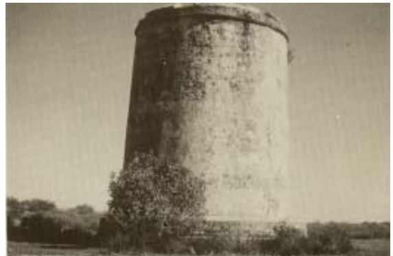
Torre Isla Canela.