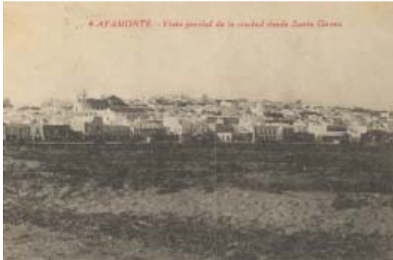
4. AYAMONTE. - Vista parcial de la ciudad desde Santa Clara