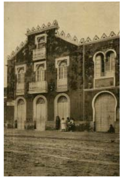
Teatro Circo Ibérico

Aunque existen testimonios fenicios y griegos es de la época romana los principales testimonios encontrados tanto en Isla Canela como en el antiguo Castillo demolido recientemente (1960/70).