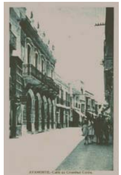
Calle Cristobal Colón