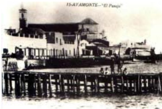
13-AYAMONTE - "El Pasaje"