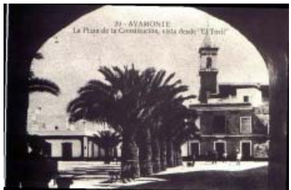
21 - AYAMONTE La Plaza de la Constitución, vista desde 'El Trío'