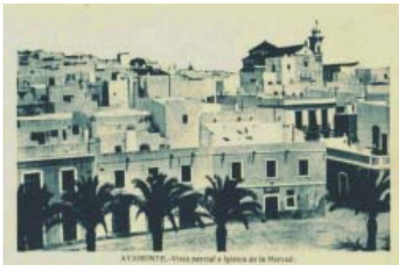
AYAMONTE. Vista parcial e Iglesia de la Merced.