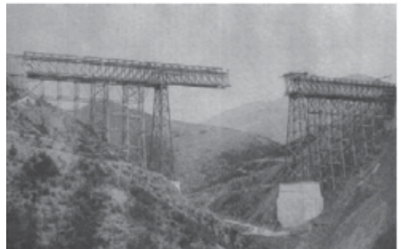
Puente de Tresfuentes en construcción.