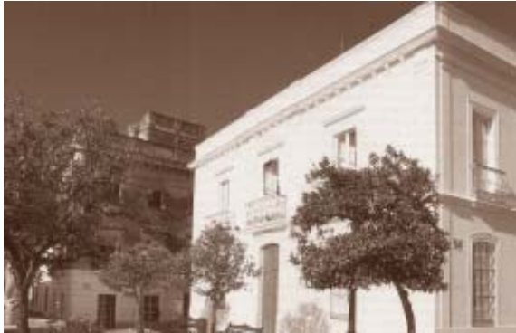
Ayuntamiento del s.XIX

Aunque se encuentran en la zona vestigios de épocas muy remotas, es de la Edad del Bronce, de cuando se aprecian asentamientos estables ligados a la extracción del mineral.