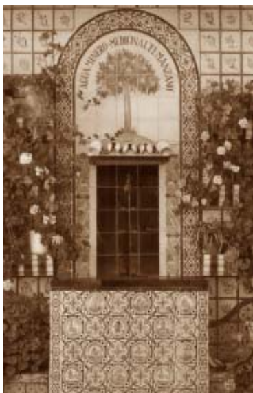
En dirección a Gil Márquez se encuentra el Balneario del Manzano.