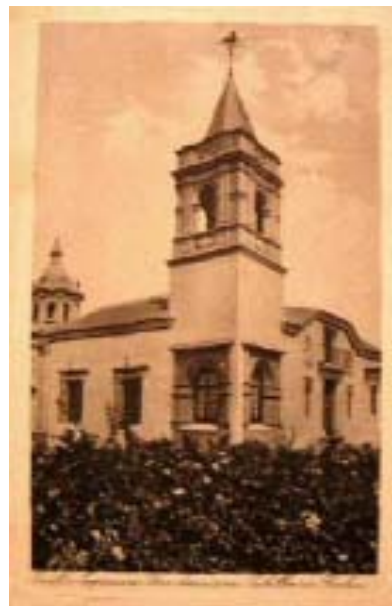
Pabellón de Huelva en la I Exposición Universal de Sevilla (1920).