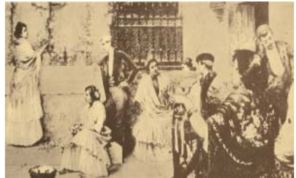
En las cruces de Mayo.