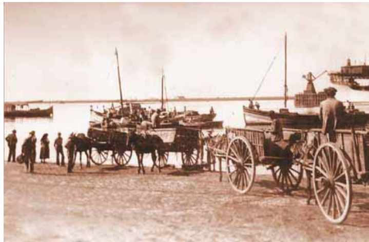
Descargando la sardina en bajamar.