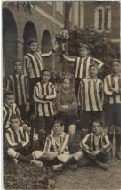
Una afición de toda la vida (1919).