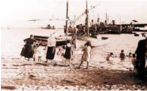
Un día de baño en la ría.