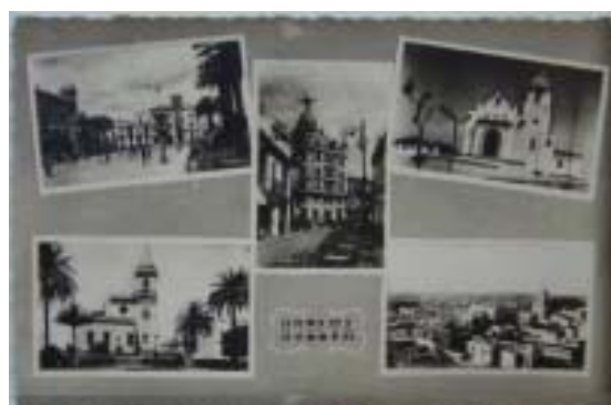
Postal: Huelva y Punta-Umbría.