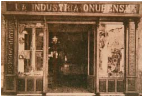
La Industria Onubense.