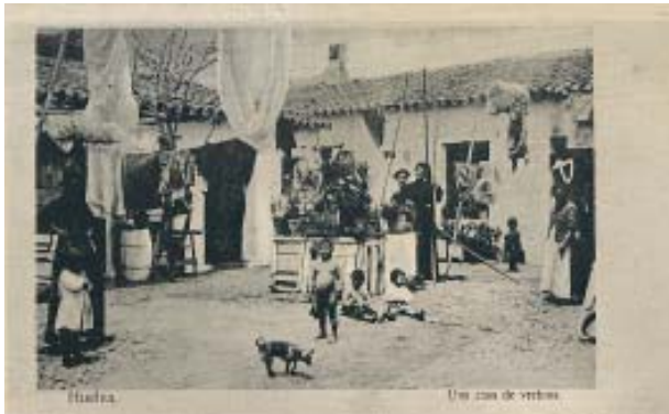
En un «Brasil» de la ciudad.