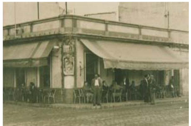
Bar «La Palma».