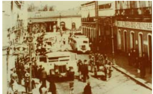
Estación de autobuses «Damas».