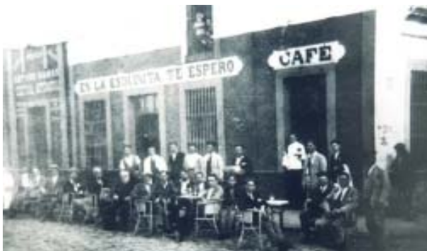
Tomando el café o la copa en una terraza.