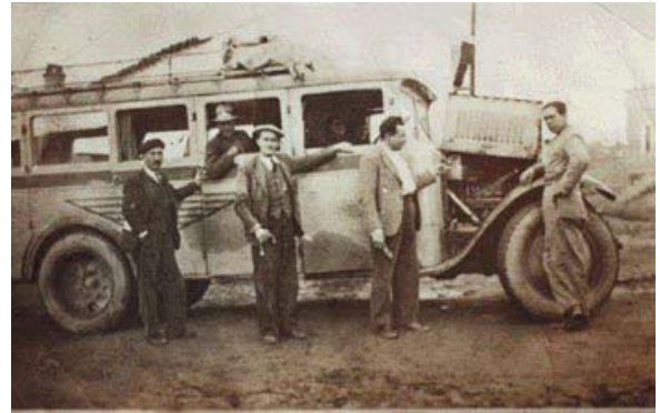
Viajeros en el primer autobús onubense.