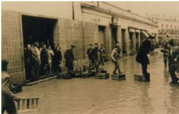
Saliendo del Mercado en una inundación.