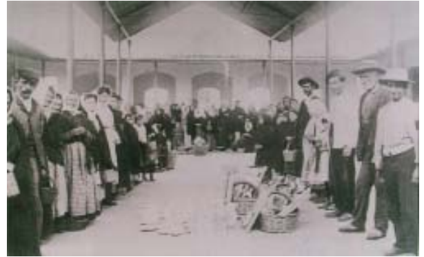
En el interior del Mercado.