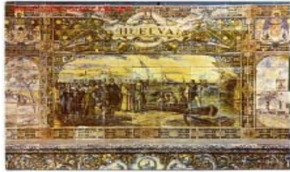
Mosaico dedicado a Huelva en la Plaza España de Sevilla.