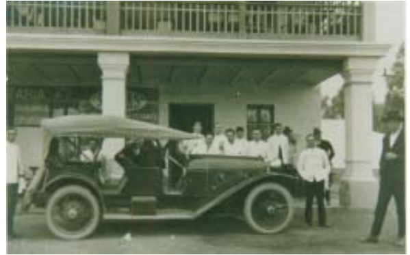
Bar-Restaurante «Isla Chica».